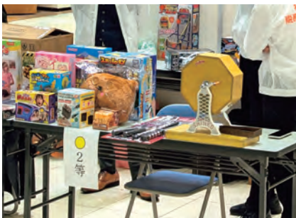
商工会による税金クイズ抽選会