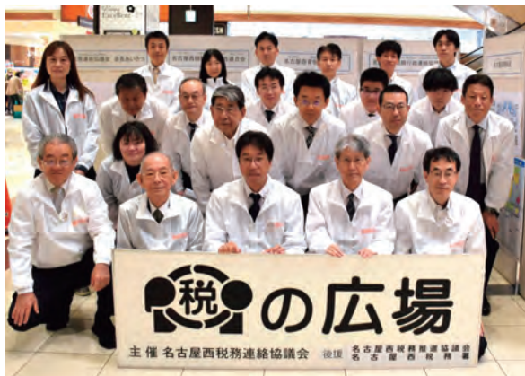
税務連絡協議会役員及びスタッフ