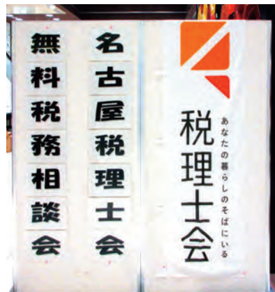
名古屋税理士会名古屋西支部による無料税務相談